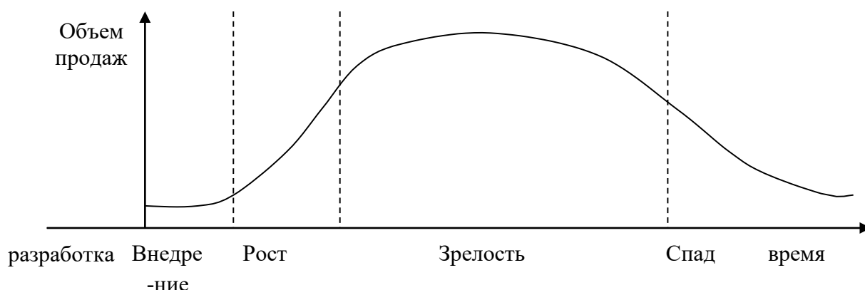
Рисунок 1.1. Кривая жизненного цикла продукта

При оформлении иллюстрации в виде графиков и диаграмм следует учитывать, что помимо графического изображения они в зависимости от их типа должны содержать следующие вспомогательные элементы: